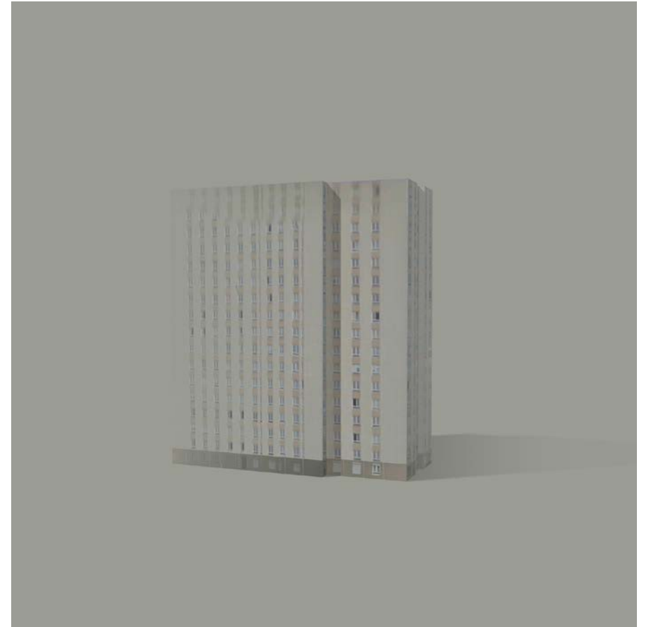
Typologie du virtuel Sans titre 5