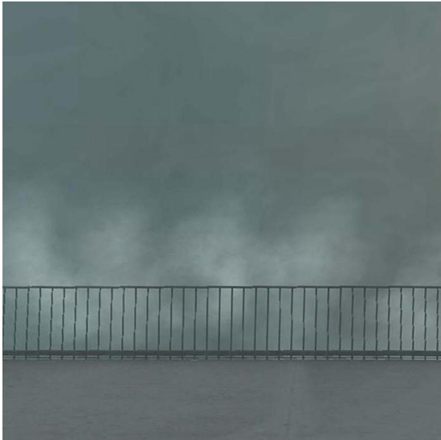
Vice city 04/01/2012 20:00