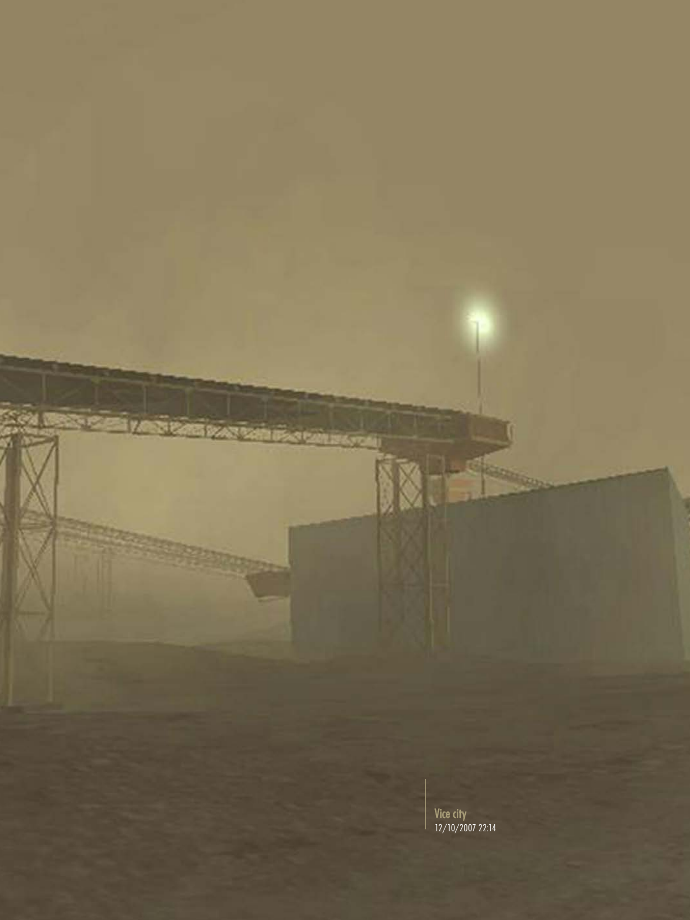
Vice city 12/10/2007 22:14