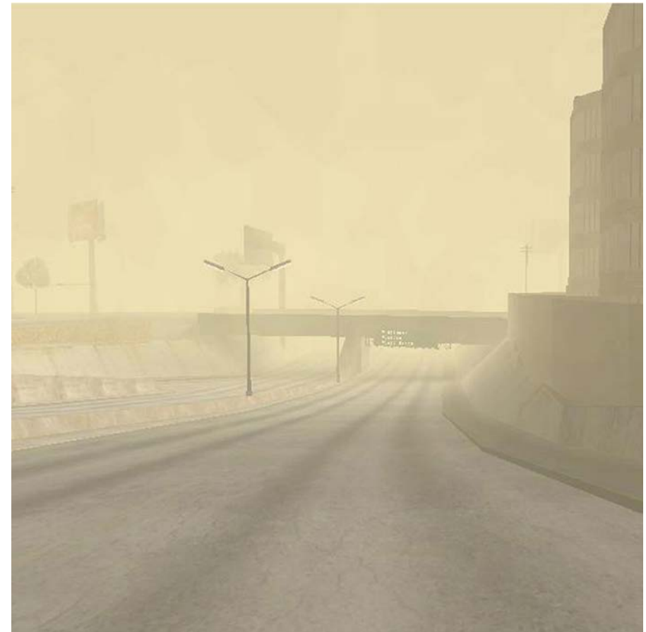
Vice city 29/08/2010 21:29